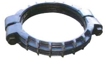
配管ジョイント (両ボルト)