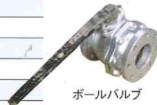
ボールバルブ (フランジ型)