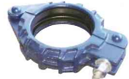
配管ジョイント (ワンタッチ型)