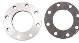
フランジ、フランジパッキング