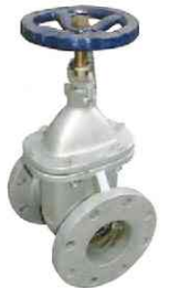
ゲートバルブ (フランジ型)