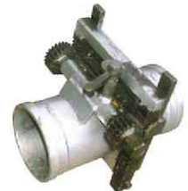
シャッターバルブ(ラチェット型)