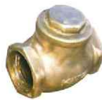
チャッキバルブ(ネジ込み)