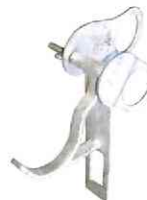
吊金物STセグメント用(固定)