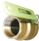
ボールバルブ (フルボア型)